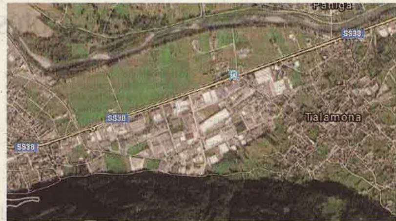
La zona industriale tra i Comuni di Morbegno e Talamona con la visione dall'alto del satellite di Google Maps

«Abbiamo avviato il confronto sul tema con le amministrazioni, le imprese e i soggetti coinvolti - spiega il presidente -. Abbiamo richieste di nuovi insediamenti, imprese di servizio e anche commerciali. Una ventina di istanze di vario genere, che toccano anche settori non regolamentati o con norme diverse tra i due Comuni.