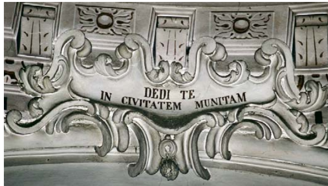
Dedi te in civitatem munitam (collocazione n. 6)

Tu dunque stringi le vesti ai fianchi, alzati e dì loro tutto quanto io ti ordinerò; "non spaventarti di fronte a loro" ( Ger 1, 17). E ancora: "Ecco, io oggi faccio di te come una città fortificata" ( Ger 1, 18): una colonna di ferro e un muro di bronzo, contro tutto il paese, contro i re di Giuda e i suoi capi, contro i suoi sacerdoti e il popolo del paese. Ti faranno guerra, ma non ti vinceranno, perché io sono con te per salvarti.