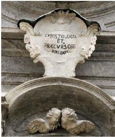
Titolo di dedicazione della Collegiata

Il tempio che domina la grande piazza reca la firma –inequivocabile– della sua dedicazione. Qui solamente per ragioni di ordine pratico si inizia a considerare il complesso esterno, che è di fattura posteriore al presbiterio [6]. Ambedue gli spazi, con un parallelismo differenziato dai contesti –solare e trionfante il primo, predisposto per far respirare un’atmosfera mistica il secondo– insieme dicono e cumulativamente celebrano quanto è essenziale della grandezza del Precursore. Il registro, che venne adottato nella configurazione ornamentale all’aria aperta, rimase quello della gravidanza simbolica quale già esplicitata dalle recitazioni fissate nel coro da Pietro Ligari. Pertanto, chi osserva oggi la facciata scopre degli elementi comuni a quella solenne ostensione di forme e contenuti che incontrerà nell’abside.