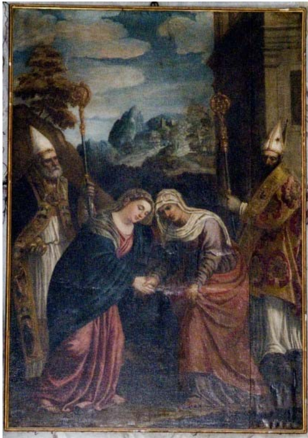
Pala dell'antica cappella della Visitazione

Ecco allora un riferimento evangelico –l'unico di natura narrativa– che viene ad integrare scene mariane ivi affrescate. Siamo a destra, nella cappella della Madonna. Appena Elisabetta ebbe udito il saluto di Maria, il bambino "sussultò nel suo grembo" ( Lc