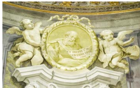
Et prophetam in gentibus dedi te (collocazione n. 2)

Alla sinistra la missione straordinaria di Giovanni viene sottolineata dal profeta Geremia: il suo detto oracolare suona: " Et prophetam in gentibus dedi te " (2). "Ti ho stabilito profeta delle nazioni" ( Ger 1, 5). Giovanni alza la voce non solo per il popolo di Israele: e Gesù, il Messia di Israele, sarà Salvatore dell'intera umanità. Il profeta è ritratto con fattezze non troppo dissimili da quelle di Isaia, ma risulta persuasivo l'atteggiamento con cui il Ligari lo disegna: in posizione assai sciolta e connotante meraviglia; soprattutto le braccia allargate concorrono ad esprimere l'ampio ambito dei destinatari del vaticino. Si tratta di un dono in gentibus .