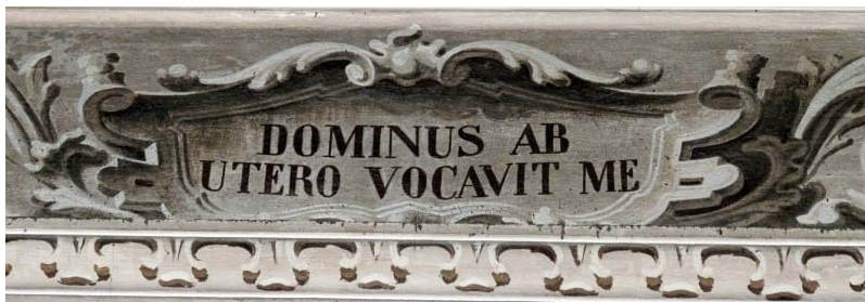
Dominus ab utero vocavit me (collocazione n. 7)

Il più e il meglio di Giovanni Battista era oramai stato detto con le scritte esaminate, sobrie ma esaurienti, sebbene aperte ad ulteriori evocazioni. Non si può negare qualche perspicacia nella scelta di altre otto citazioni, tratte da vari libri biblici [50], allorché si pensò al nuovo abbellimento del tempio. L'intento fu quello di conferire anche spessore di annuncio ad un progetto fondamentalmente decorativo. Vi trapela solo –a mio avviso– qualche piccolo inconveniente di disposizione spaziale in rapporto ad una coerenza tematica sul filo della quale corre il presente discorso. La numerazione dei cartigli contenenti queste citazioni allegorico–agiografiche facilita una rilettura contenutistica più coerente e forse anche più significativa in ordine alla sintassi dello spazio sacro [51].