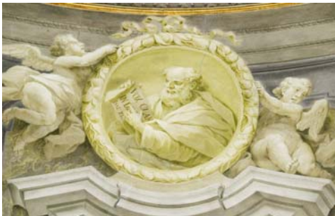
Vox clamantis in deserto (collocazione n. 1)

Alla destra sta Isaia. Un volto pensoso e ieratico; gli danno risalto la barba e la fronte stempiata. Dal manto che ricopre le spalle emergono il braccio sinistro (il cartiglio è sostenuto col destro) e la mano che tocca il massimo di espressività nel dito puntato sulla parola profetica: " Vox clamantis in deserto ": così il testo esibito (1). E con tutta verità, perché la identificazione inequivocabile e la portata attualizzante di questa "voce che grida nel deserto" viene proposta –addirittura– dall'Evangelo di Matteo ( Mt 3, 2).