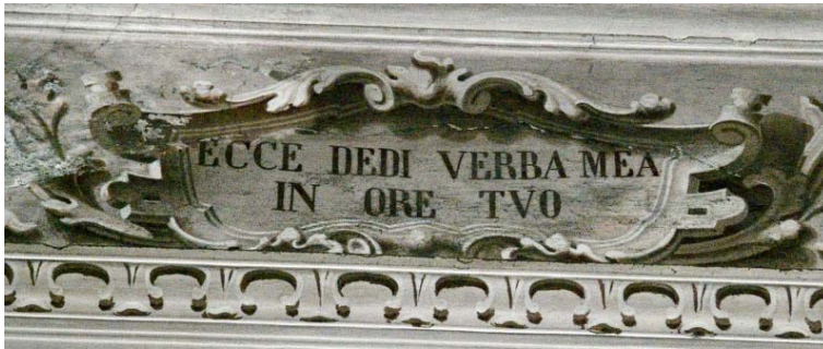
Ecce dedi verba mea in ore tuo (collocazione n. 11)

"Ecco, io metto le mie parole sulla tua bocca" (Ger 1, 9).