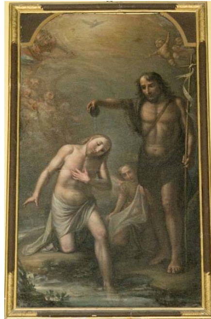
Icona per il fonte battesimale

Proviene dall'antico tempio di San Giovanni la prima raffigurazione del Battesimo di Gesù. Benché la tela barocca non sia di pregevolissima fattura, è atta a comunicare il clima di intensità misterica del sublime evento. La si può pensare collocata sulla sfondo della cappella che ospitava il battistero, dopo la sua traslazione dal tempio dei Santi Pietro e Paolo. La presenza di questa scena nei battisteri risulta come una delle preoccupazioni liturgiche e insistenti disposizioni vescovili emesse nei decreti della visite pastorali del XVII secolo [17]. La tela sopravvisse nel nuovo tempio di San Giovanni come complemento dell'apparato del sacro fonte. Oggi sormonta l'entrata della primitiva sacrestia che si apriva sulla parete destra dell'area presbiteriale. La ricollocazione è indovinata, in posizione il più possibile vicina alla vasca battesimale, ove posta attualmente.