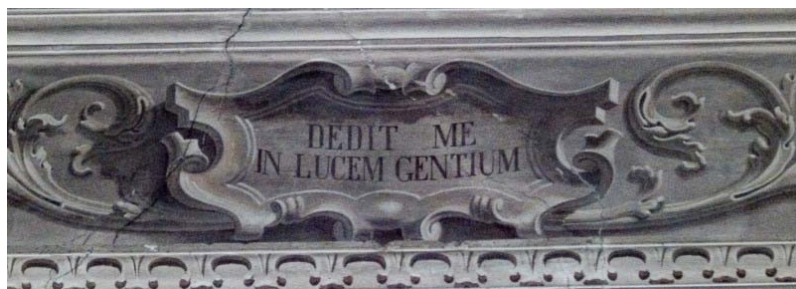
Dedit me in lucem gentium (collocazione n. 14 )