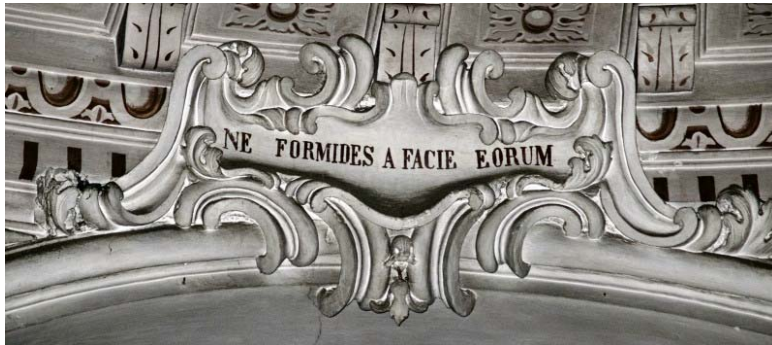
Ne formides a facie eorum (collocazione n. 5)

Tuttavia la verità del ministero profetico è data, ancor più che dall'annunciare, dal pagare di persona, con fedeltà a tutta prova. Lo sguardo si deve dirigere ora, specularmente, sulla parete di sinistra, alla sommità delle logge che affiancano la cappella della Pentecoste [48].