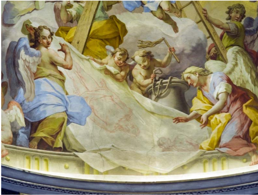
L'impronta di Gesù cadavere affrescata da Pietro Ligari (particolare del catino absidale)

Il ritorno su un piano superiore propone all'attenzione il sudario con il volto insanguinato di Gesù impresso durante l'ascesa al Calvario, secondo la tradizione della Veronica (vera icone); poi la scala per la deposizione del cadavere. Accanto alla figura della grande Croce ecco, a destra, il contestato cartiglio con la scritta "I.N.R.I." (Gesù Nazzareno Re dei Giudei) che sovrastò il capo di Gesù; e a sinistra il calice simbolico dell'agonia del Getsemani. Infine, tre grossi chiodi acuminati per la crocifissione, sorretti entro un bianco panno da due angioletti.