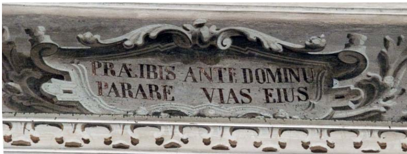
Praeibis ante Dominum parare vias eius (collocazione n. 13 )