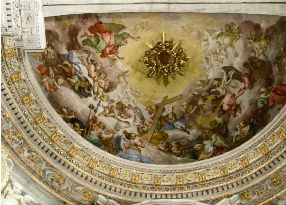
Il catino dell'abside affrescato da Pietro Ligari

fermare gli occhi su ciascuna delle figure d'angeli e di putti, che formano una ghirlanda inneggiante alla Passione del Signore. Nulla del racconto evangelico è stato trascurato. L'artista venne guidato sapientemente nel fissare una plenaria evocazione e nell'effigiare un devoto e realistico inventario comprensivo d'ogni particolare. Con un'essenzialità non meno eloquente di una Via Crucis .